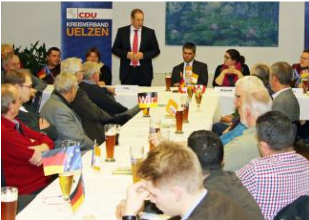
Auf den Parteitag in Uelzen-Hanstedt II (oben) und Celle-Garßen (rechts) wurde über den bevorstehenden Bundesparteitag sehr lebhaft und engagiert diskutiert.

Im Vorfeld des CDU-Bundesparteitages fanden in meinem Wahlkreis bei den beiden Kreisverbänden Celle und Uelzen Kreisparteitagen statt, auf denen die Mitglieder die aktuelle Lage der CDU und die Wahl des Bundesvorstandes sehr lebendig diskutierten. Fazit ist: Wir sind aktiv, aber agieren auch geschlossen. Damit gestalten wir die Zukunft Deutschlands positiv.